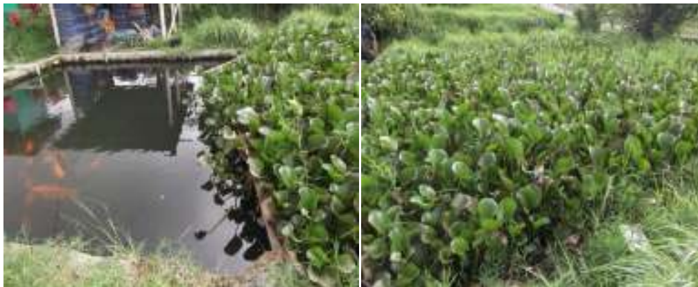
Gambar 4 – Contoh kolam penampungan untuk filterisasi kontaminan