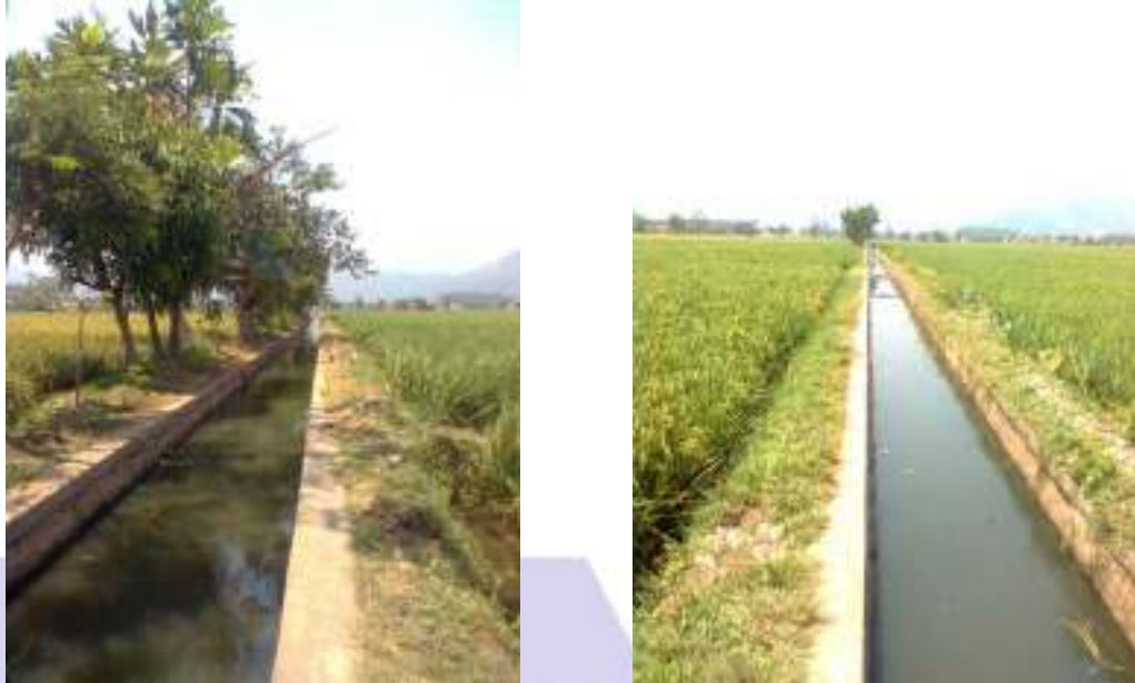
Gambar 3 – Contoh buffer zone berbentuk parit