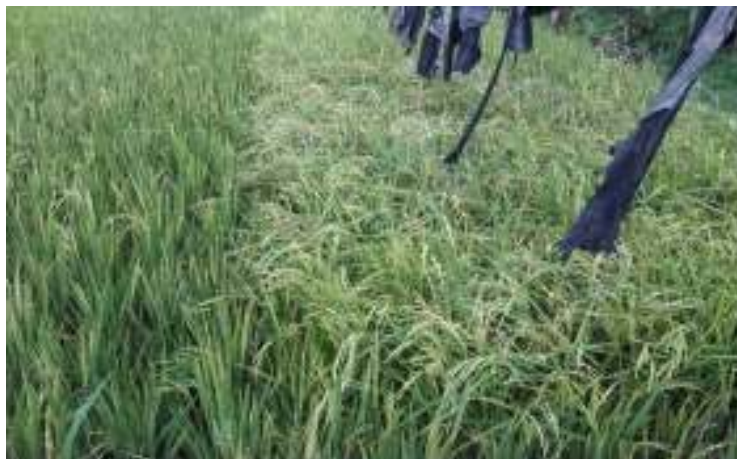
Gambar 2 – Contoh tanaman penyangga pada tanaman semusim